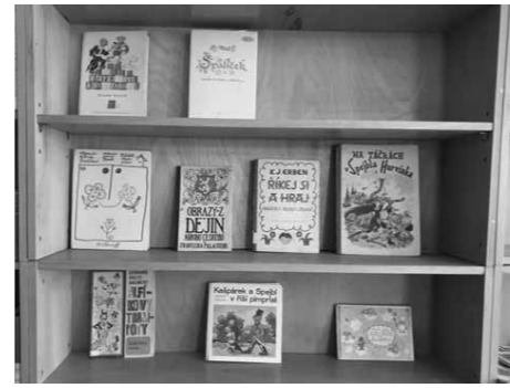
Místo pro knihovnice