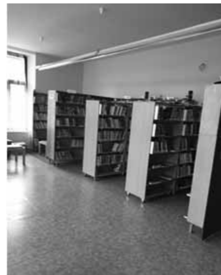
Místo, kde si vyberete knihu