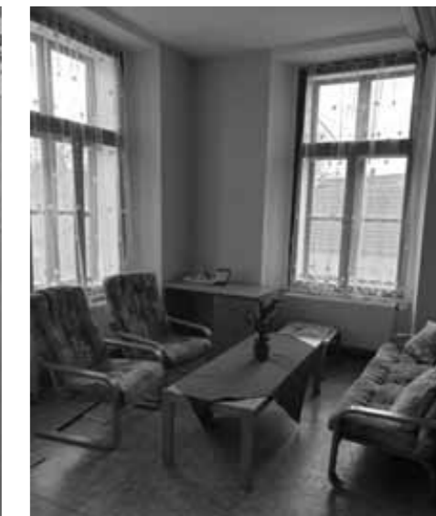
Relaxační kout na čtení knihy, povídání, pití kávy a čaje.