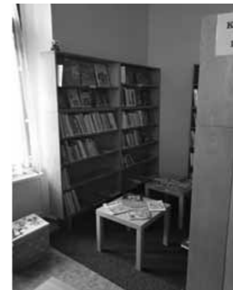
Kout pro děti