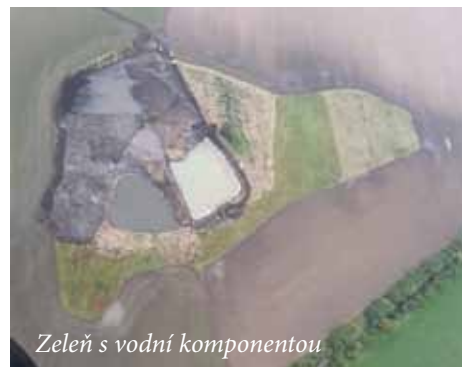
Zeleň s vodní komponentou

Obec se soustředí na prvním místě na splacení závazků a následně investice musí přispůsobit, jelikož dochází ke krácení příjmů obcí státem.