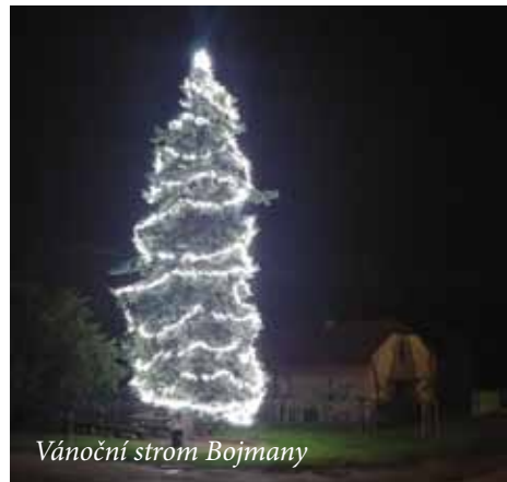
Vánoční strom Bojmany

šicích proběhlo dne 28. 11. 2020 od 17 hodin a v Bojmanech dne 29. 11. 2020 od 17 hodin. Z důvodů preventivních opatření proti možnému šíření nákazy COVID-19 proběhly obě akce bez účasti občanů. Ve