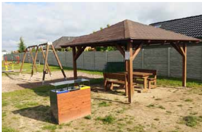
Altán na dětském hřišti Žehušice