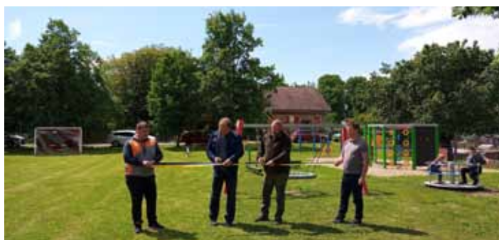
Otevření Relaxační a fitness zóny pro všechny generace Bojmany