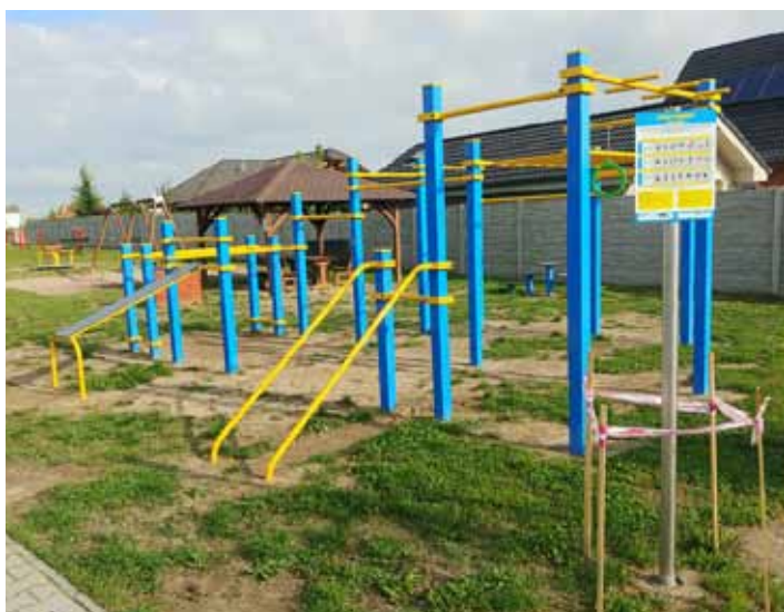
Workoutová sestava Žehušice

Relaxační a fitness zóna pro všechny generace byla vybudována v celkových nákladech 974.086,- Kč. Z Ministerstva pro místní rozvoj z Programu podpora rozvoje regionů 2019+ byla poskytnuta částka ve výši 639.462,- Kč. Dotace byla využita pro obě naše obce - Žehušice a Bojmany. V Žehušicích bylo vybudováno workoutové hřiště a altán.