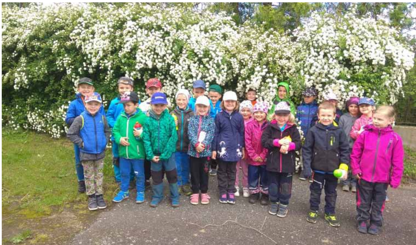
ZŠ J. V. Sticha-Punta Žehušice

Na Mikuláše v roce 1995 vstoupili do nové postavené budovy základní školy první učitelé a první žáci. Od té doby se vystřídalo několik generací žáků a vystřídala se i řada učitelů a učitelek u školní tabule.