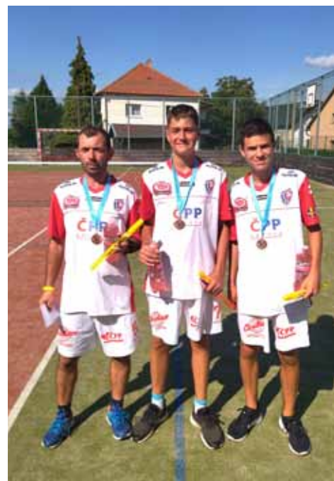
3. místo - Plíšci