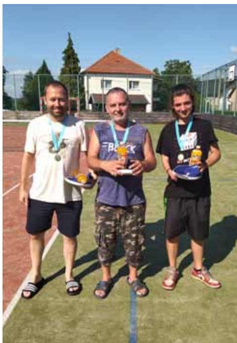
1. místo - Verunáčovci