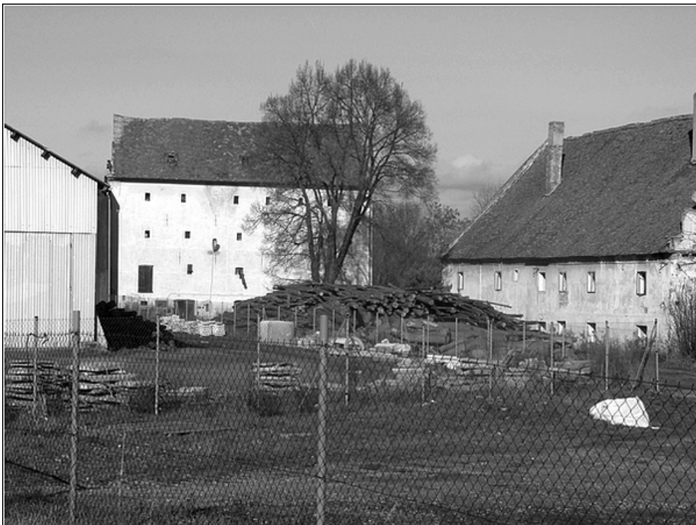
F12 – okolí tvrze