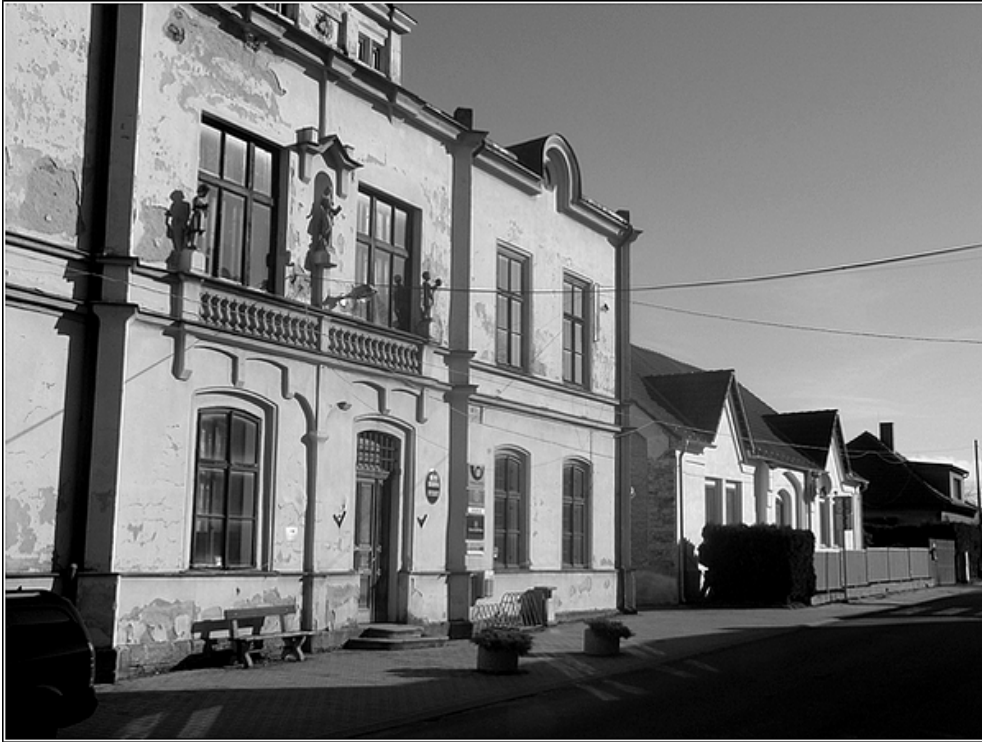
F3 – knihovna