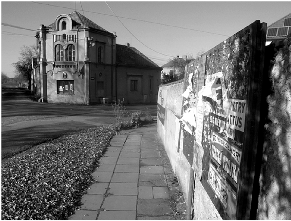
F17 – plakátovací stěny