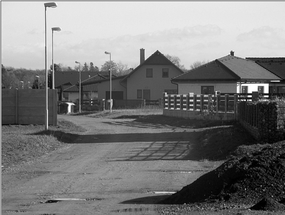
F 27 – nová výstavba