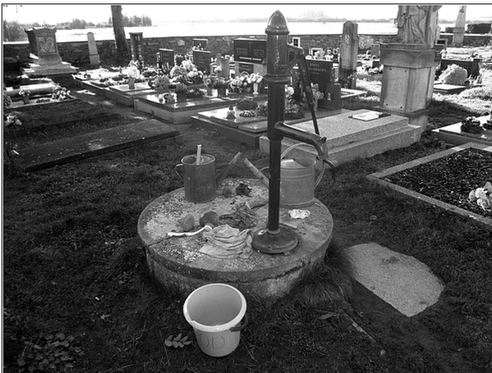
F 32 – pumpa na hřbitově