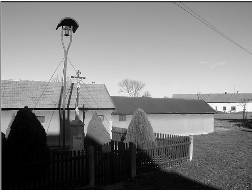
F 45 – zvonička