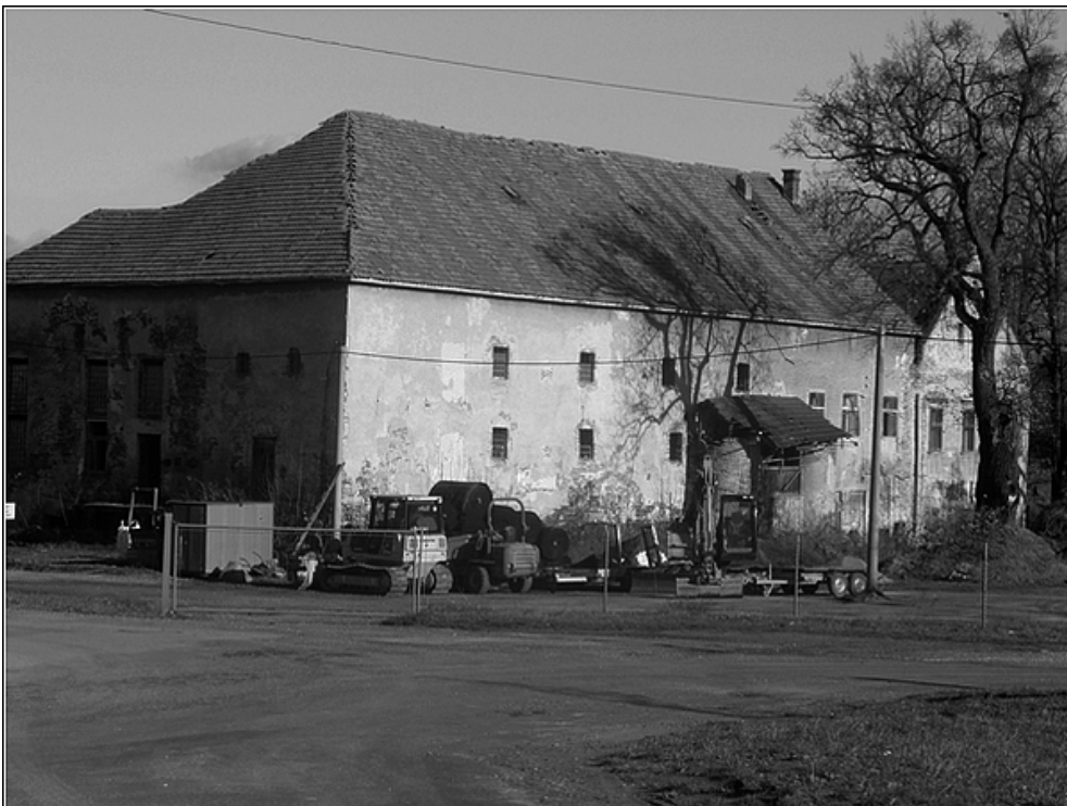
F10 – tvrz