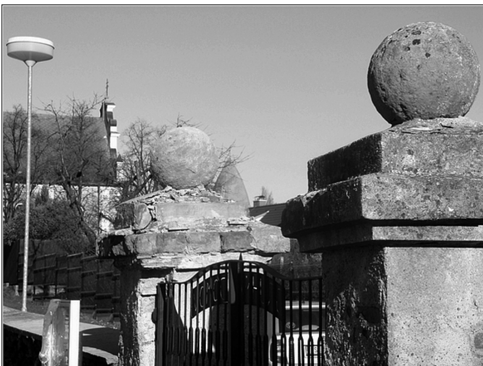
F 34 – vstup na hřbitov