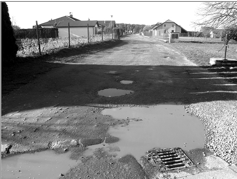
F20 – místní komunikace