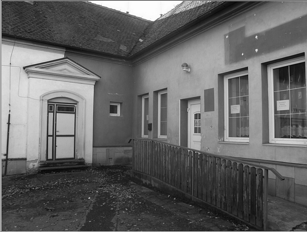
F9 – občanská vybavenost