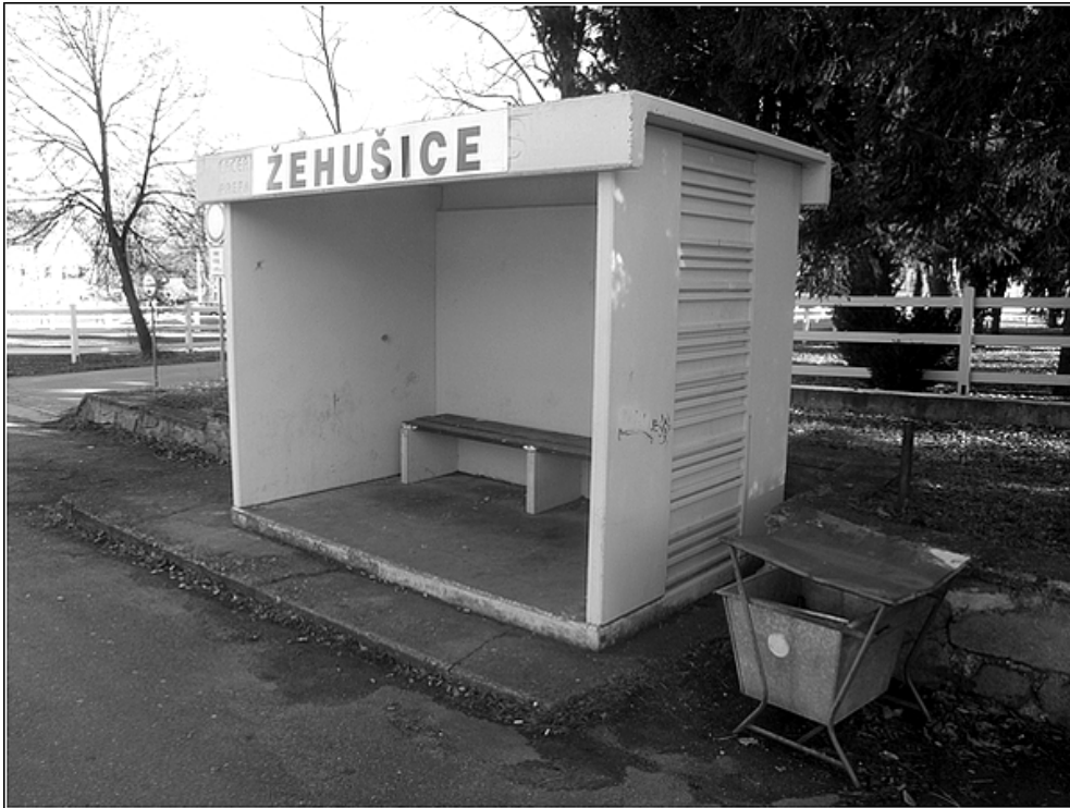
F11 – autobusová zastávka