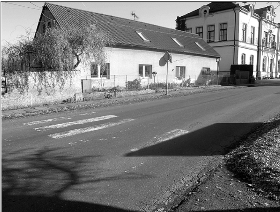
F2 – Přejechod na hlavní silnici