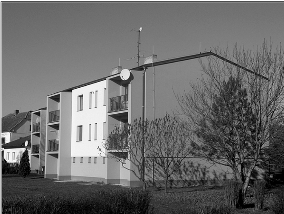
F22 – bytovky