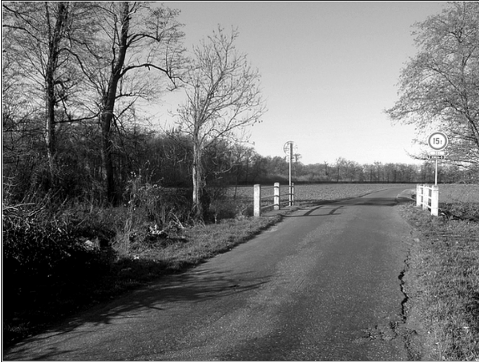
F 48 – most