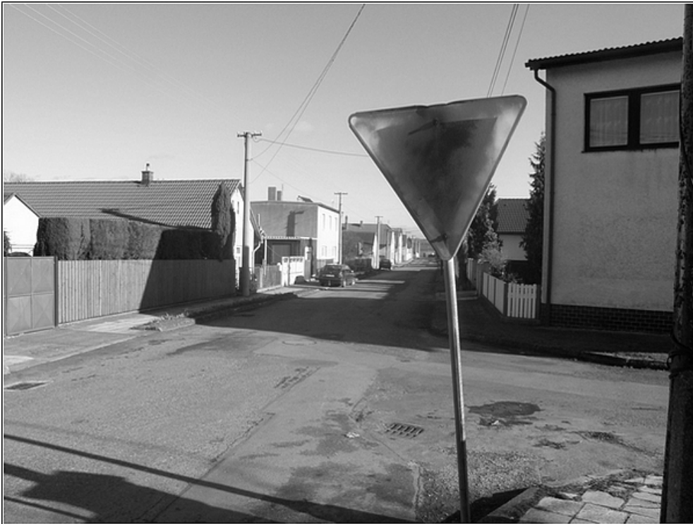
F 25 – svislé dopravní značení