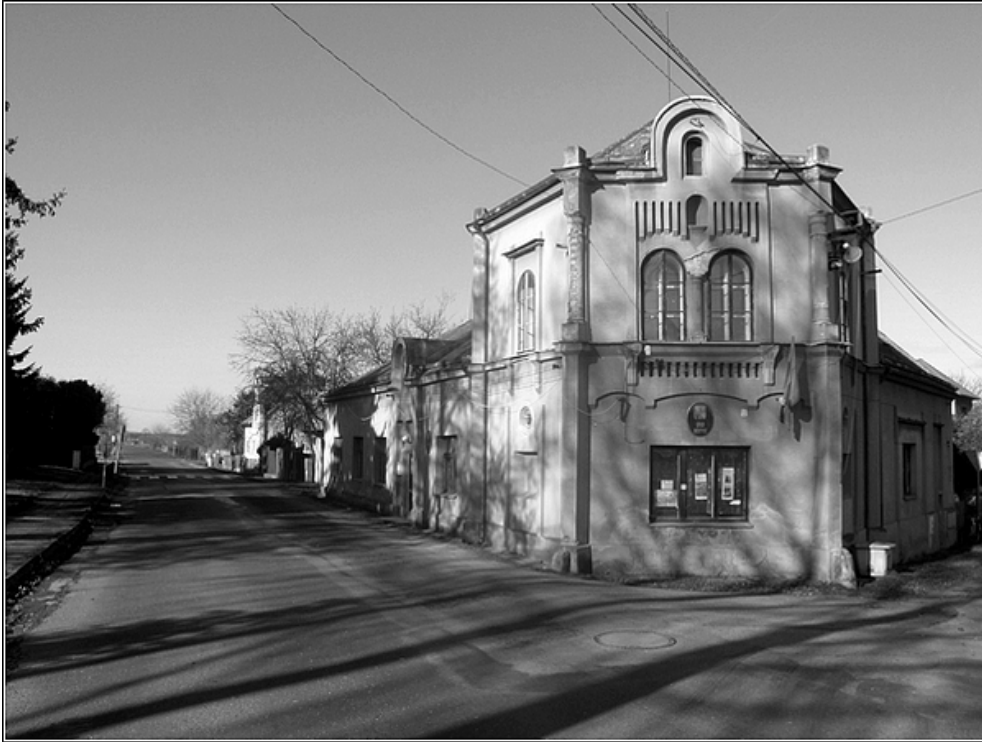
F1 – Úřad městyse