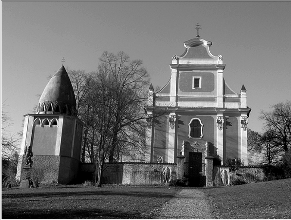
F5 – kostel Svatého Marka