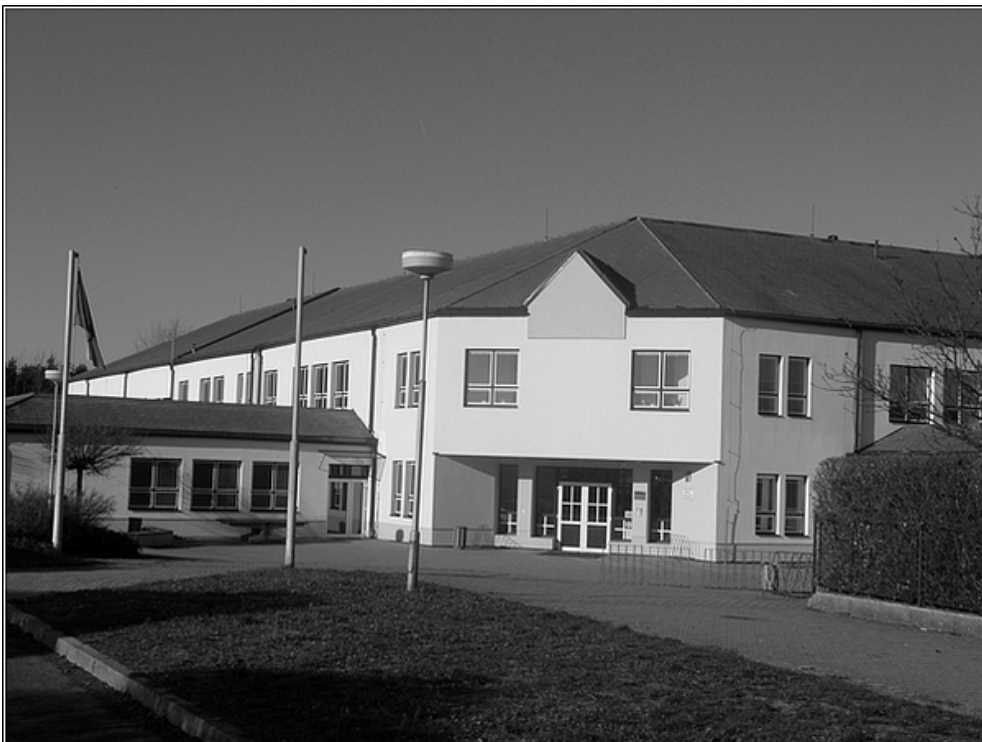
F 26 – základní škola