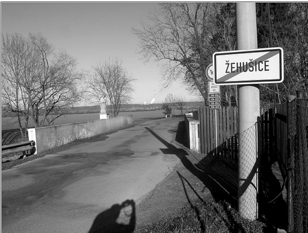
F 38 – most