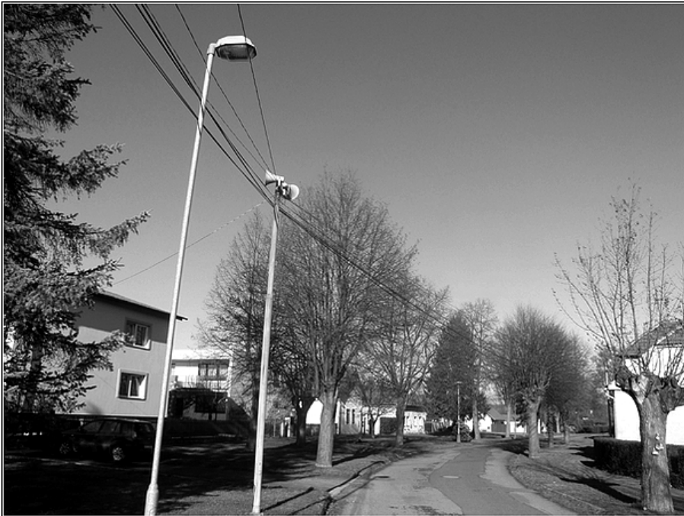
F21 – vzdušná vedení