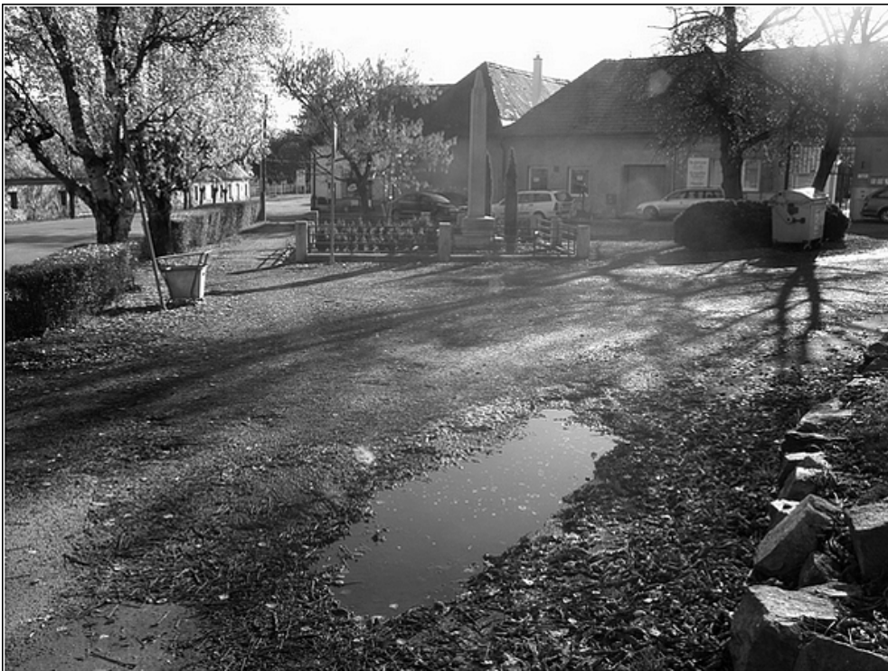
F4 – prostor pod kostelem