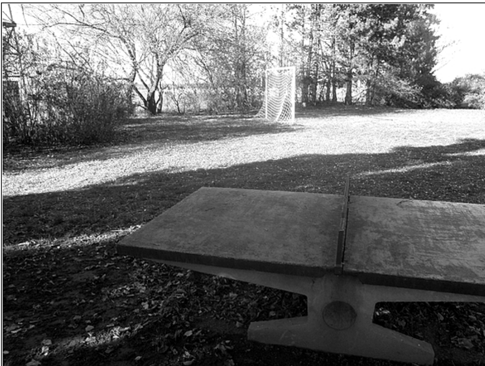
F 30 – sportoviště