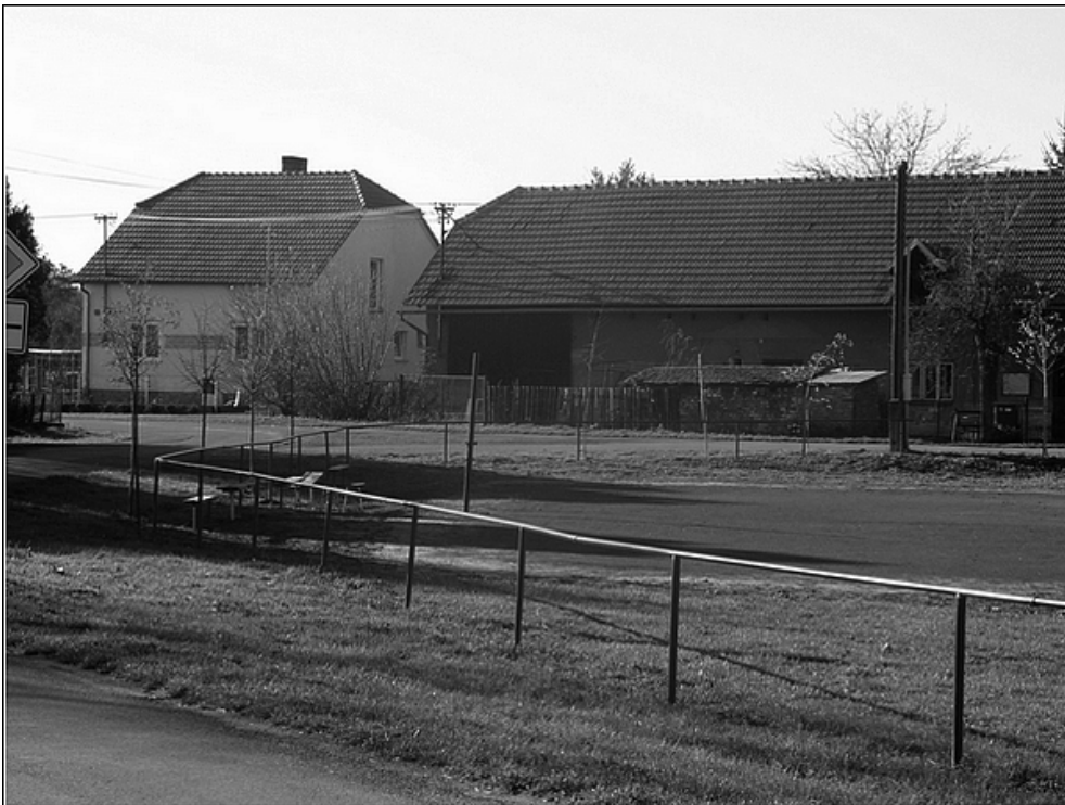
F 41 – hřiště