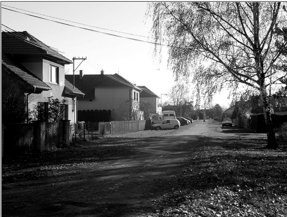
F 43 – okrajová část