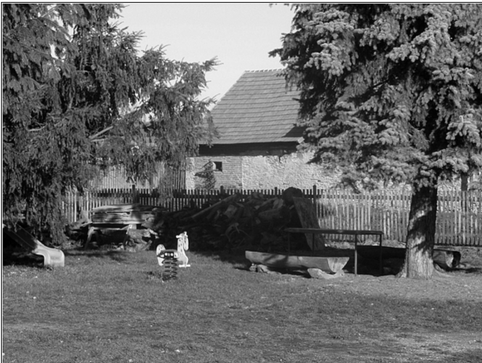
F 47 – dětské hřiště