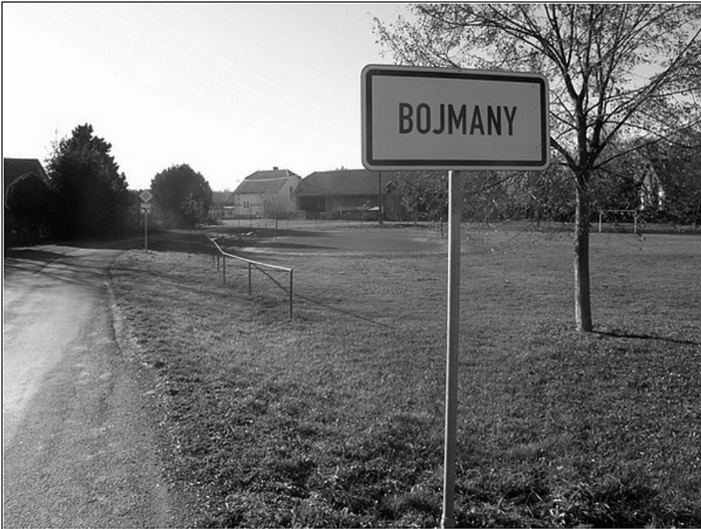
F 40 – Bojmany