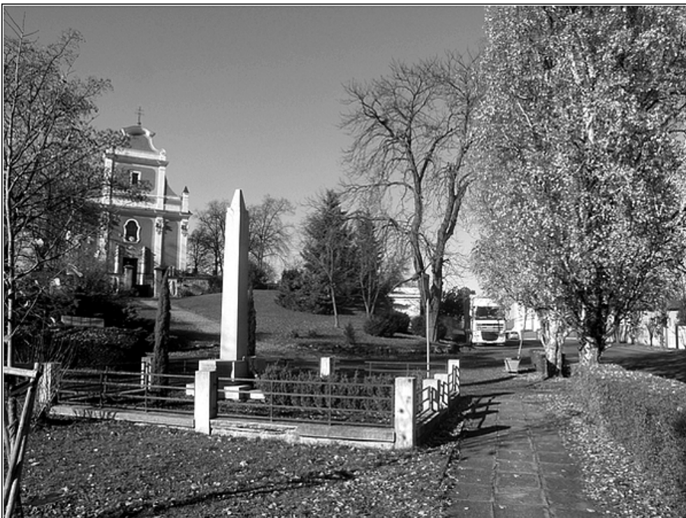
F8 – pomník pod kostelem