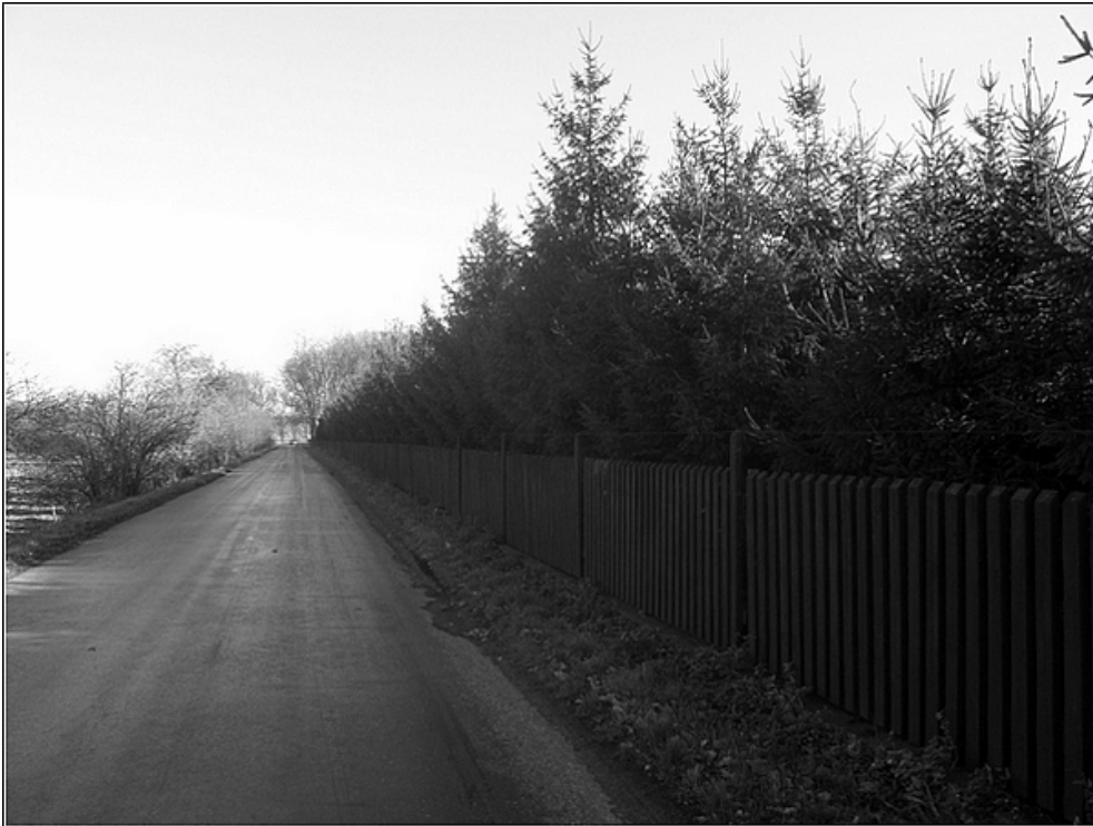
F 39 – cesta do místní části Bojmany