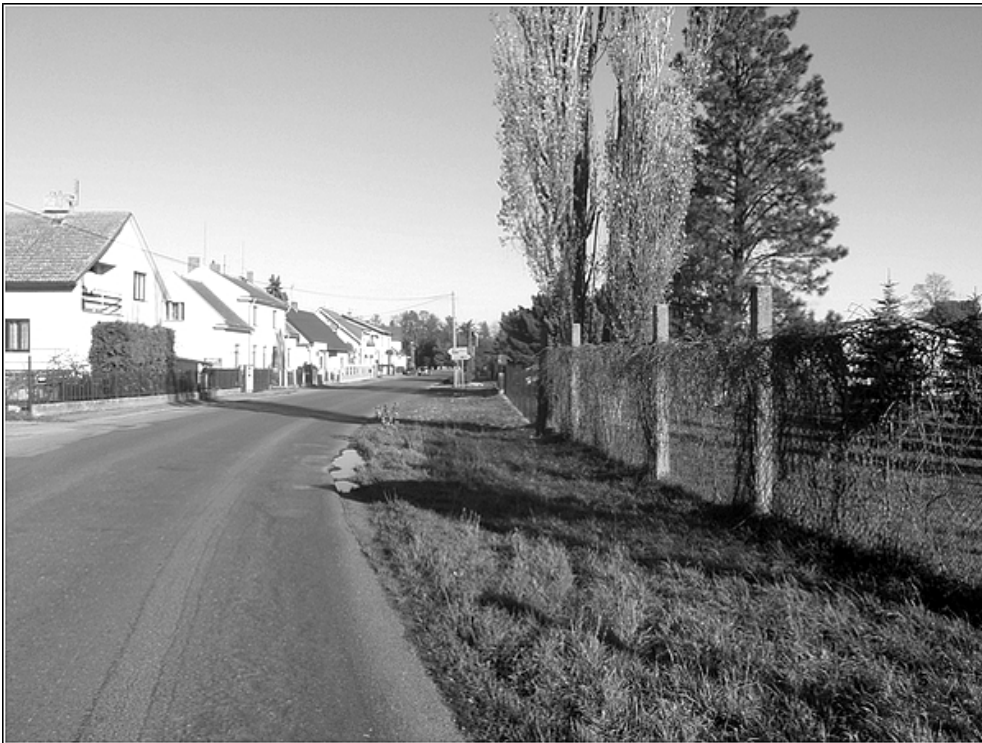
F 36 – příjezd do obce