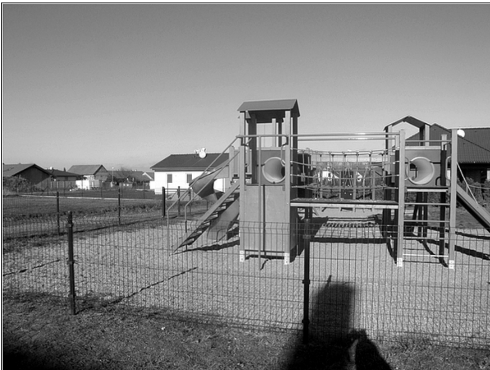
F 28 – dětské hřiště