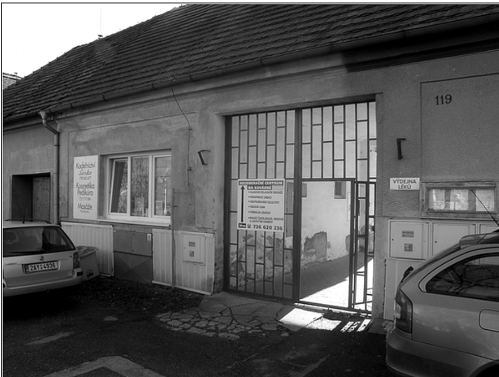
F6 – občanská vybavenost