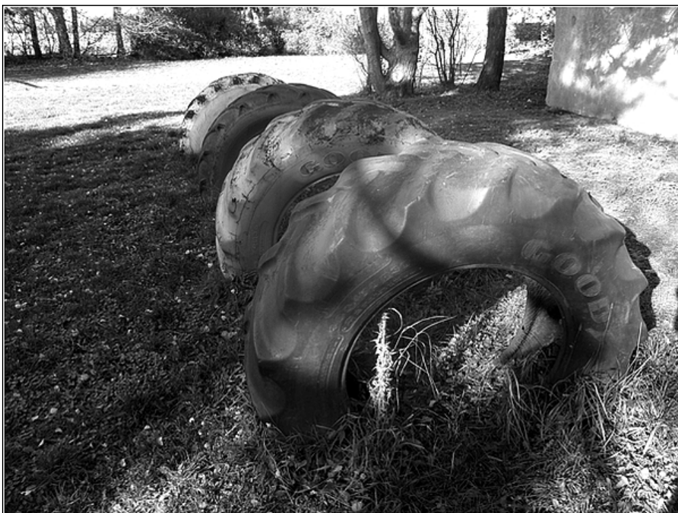
F 31 – staré dětské atrakce