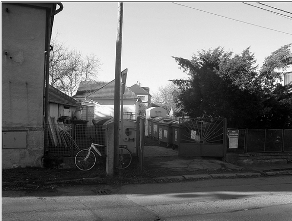
F18 – Prostor za obecním úřadem