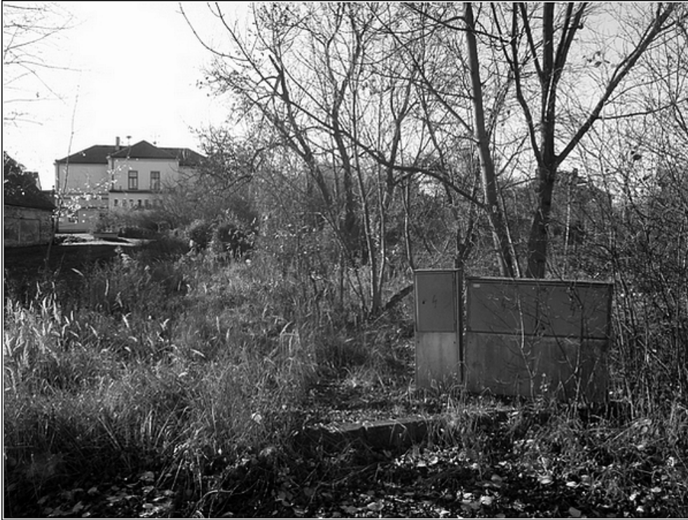
F 29 – zákoutí pod knihovnou