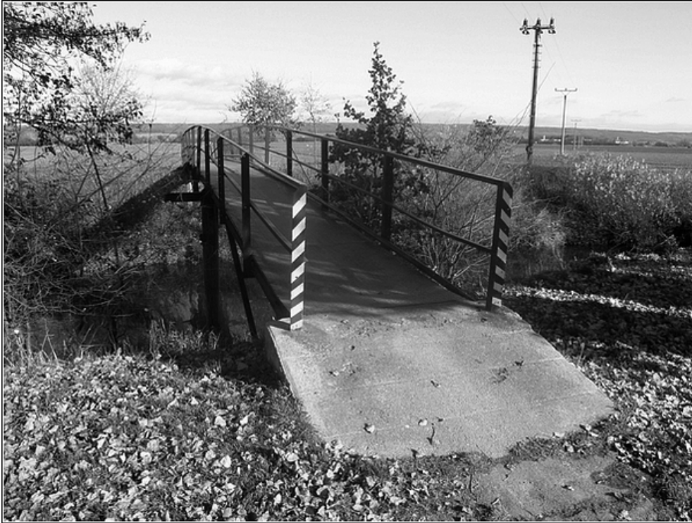
F 23 – lávka