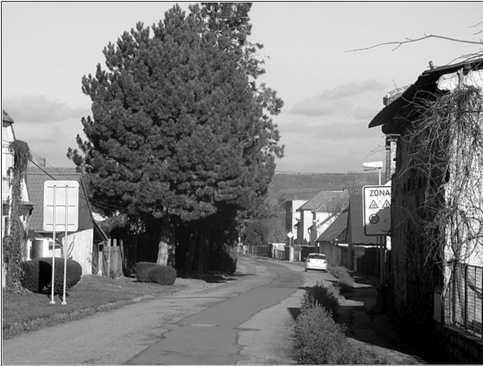
F19 – veřejná zeleň