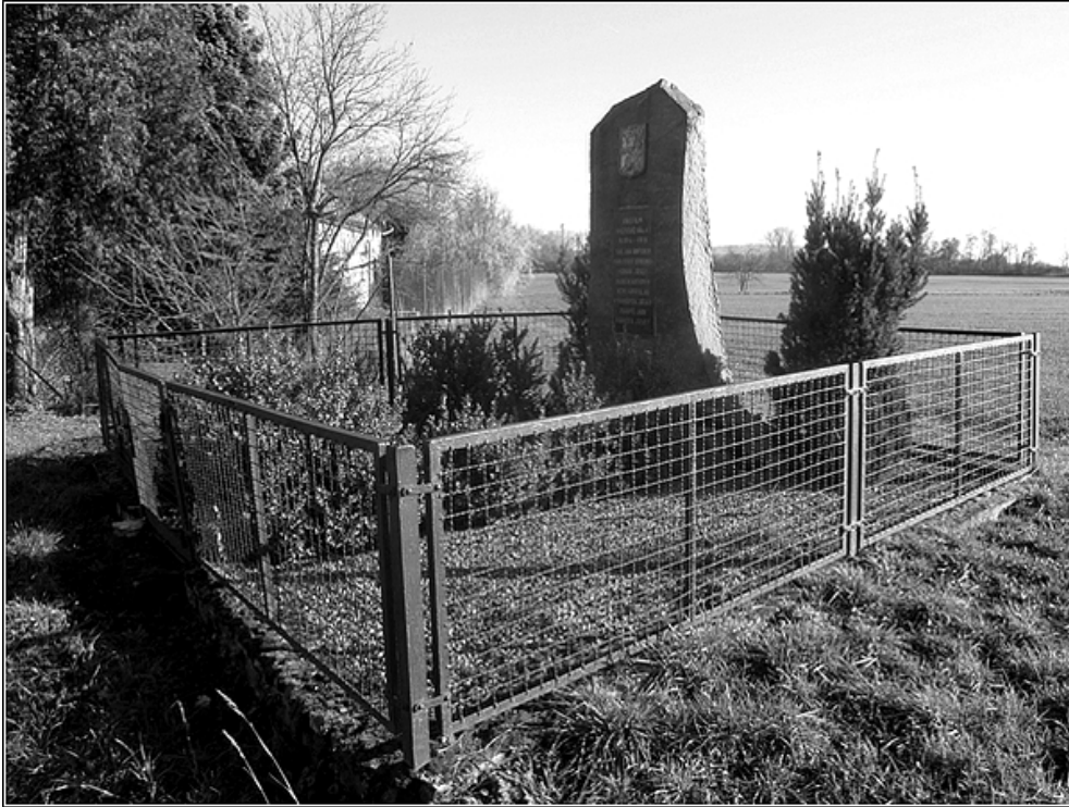
F 44 – pomník