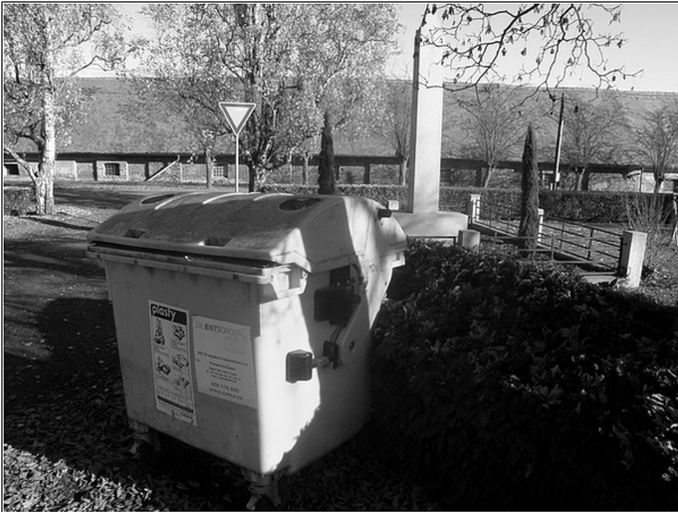
F15 - Třídění odpadu