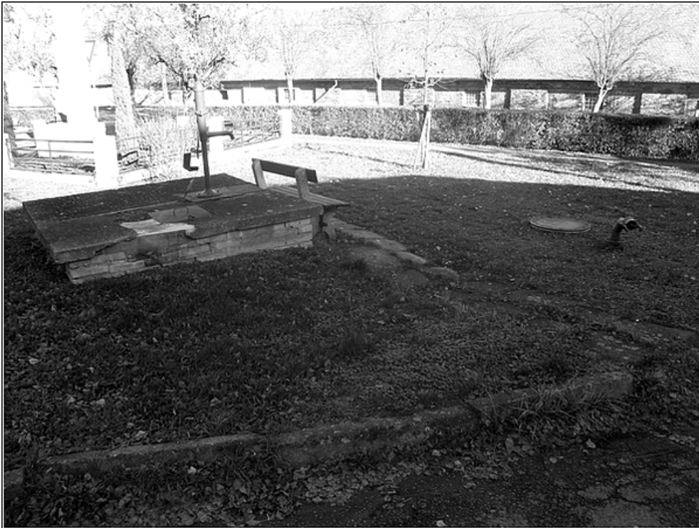
F7 – studna