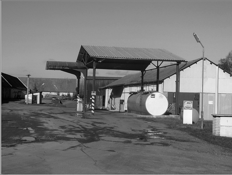
F13 – čerpací stanice PHM