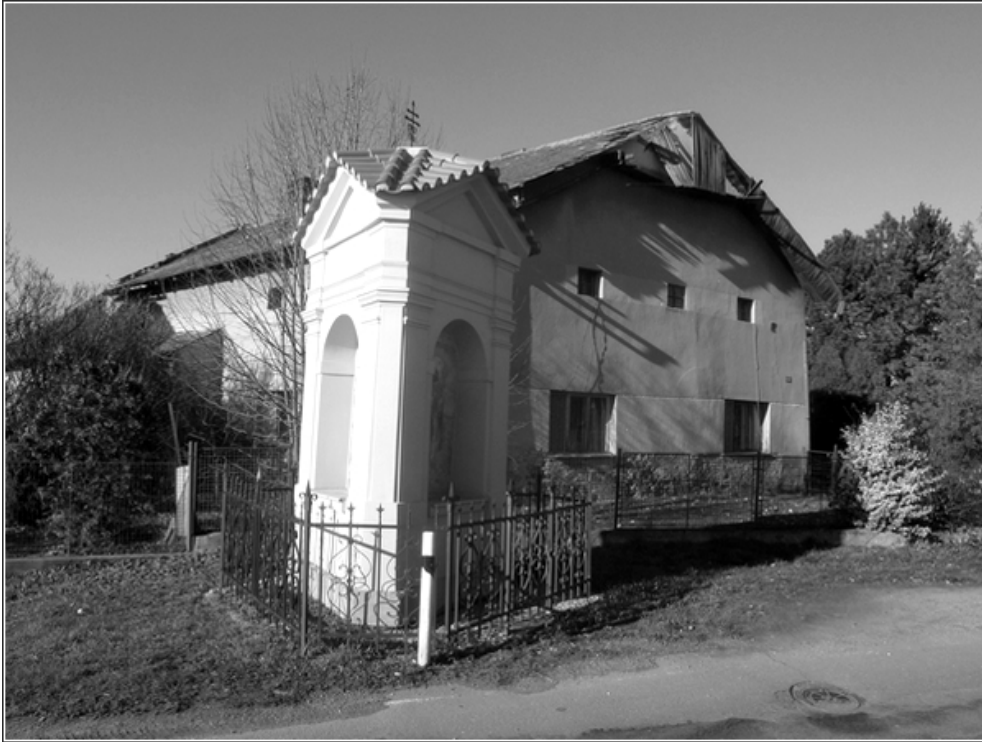
F 35 – výklenková kaple