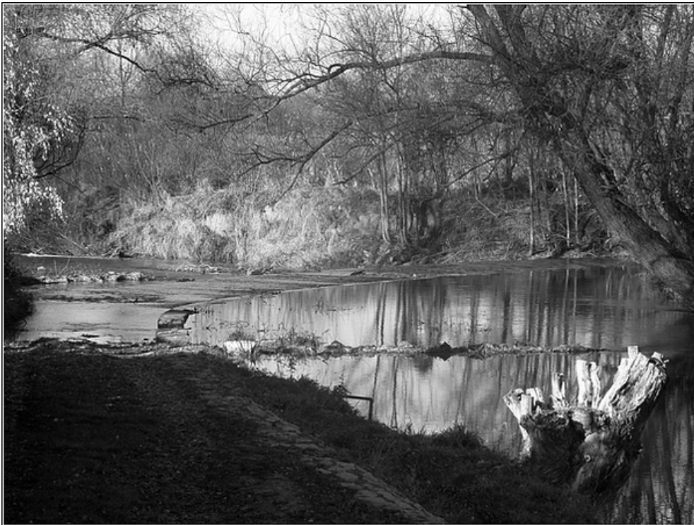
F 24 – brod