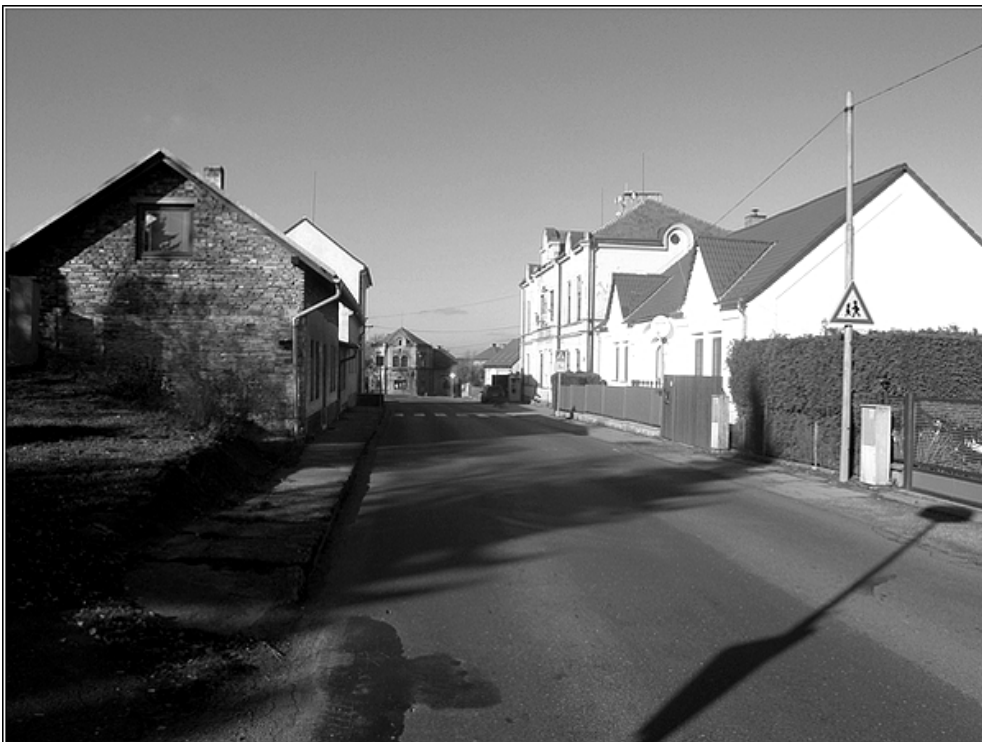
F16 – chodník v centru