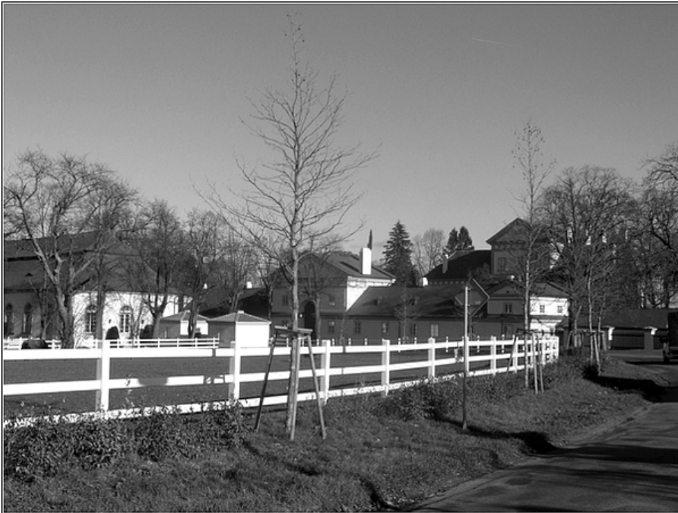
F 37 – zámek