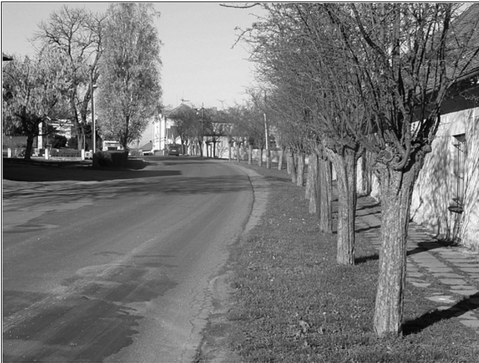
F14 – střed městyse