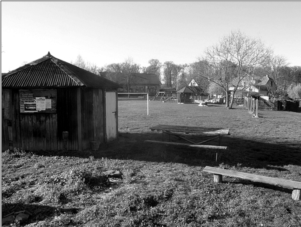
F 42 – přístřešek na hřišti