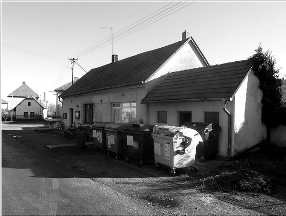
F 46 – Třídění odpadu